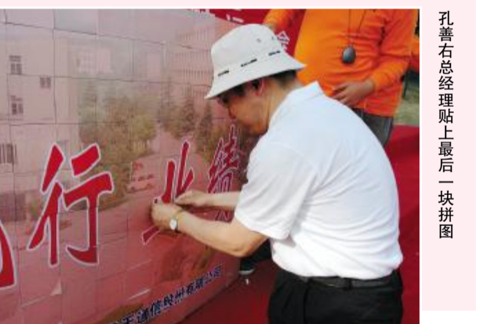
孔善右总经理贴土后后一捺拼图