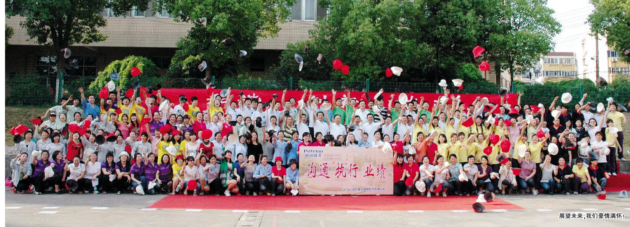
展望未来,我们豪情满怀!